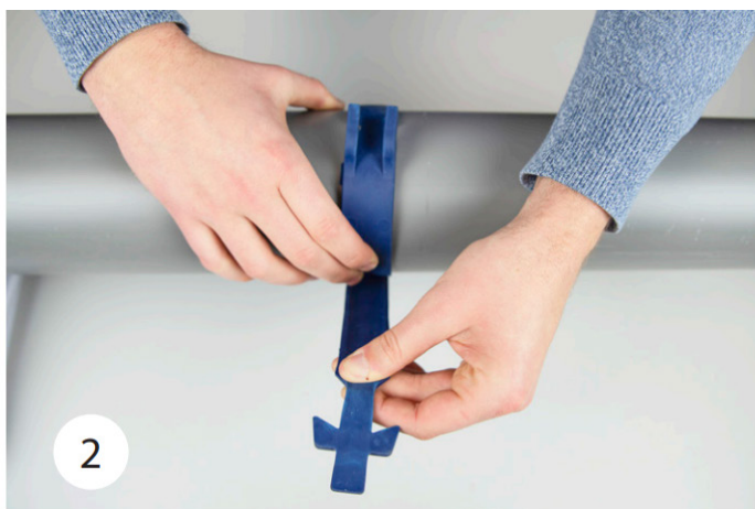
2. HyDra® Pipe Strap monteres centreret i væggen. Fasthold enden af stroppen med den ene hånd, og træk den anden ende af stroppen rundt om røret.

Bemærk: Vi tager forbehold for trykfejl og henviser til at den gældende version af data altid er tilgængelig på www.haucon.dk eller kan rekvireres ved at kontakte ekspeditionen. Aktuelt revisionsnummer står øverst i venstre hjørne.