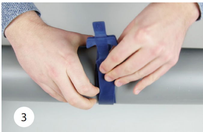
3. Lås HyDra® Pipe Strap i modhagen.