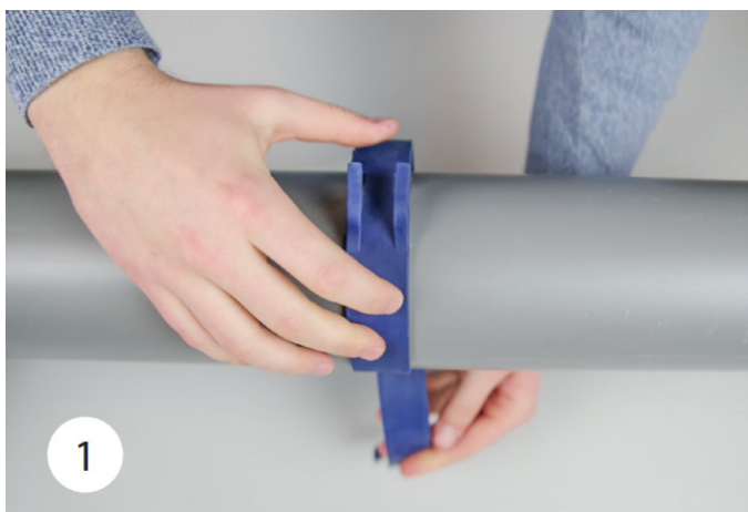
1. Monter HyDra® Pipe Strap rundt om røret.