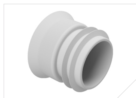
Vand-Con Prop RST D