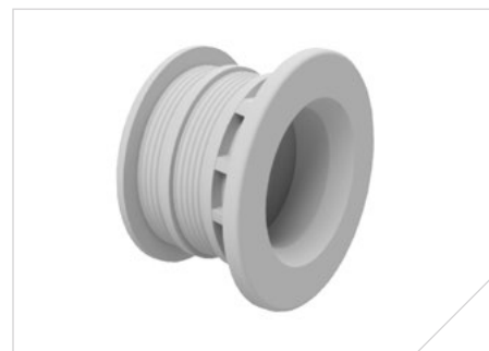
Vand-Con Kappe RK D

Bemærk, at ved anvendelse af Vand-con kappe reduceres rørets totallængde med 9,5 mm pr. kappe.