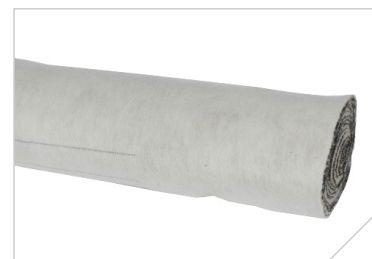
HyDra Tex 5000 C

HyDra Tex bør ikke udsættes for direkte ydre påvirkninger under opbevaring. Dæk alle ruller med plastik eller en presenning. Fjern ikke den omkringliggende beskyttelse før installation.